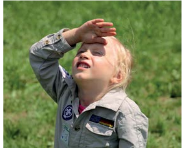
Biber haben ihre eigene Perspektive beim Blick auf die Welt

Für die Bibergruppe haben wir die drei folgenden Ziele definiert, die die Kinder in ihrer Biberzeit mit Hilfe ihrer Leiterinnen und Leiter erreichen sollen.