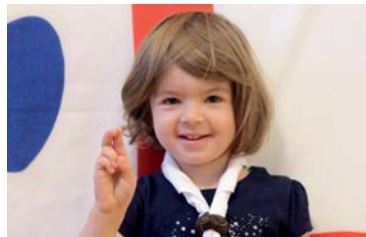
Ein Biber mit weißem Halstuch und Bibergruß, dem Handzeichen der Bibergruppe

Das Erkennungszeichen der Biber ist das weiße Halstuch. Als Mitglieder der DPSG können sie außerdem Kluft tragen.